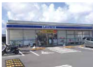
■ローソン 徒歩3分(約182m)