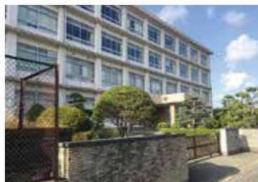
■金目中学校 徒歩21分(約1,603m)