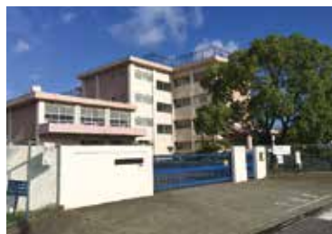
■みずほ小学校 徒歩11分(約878m)