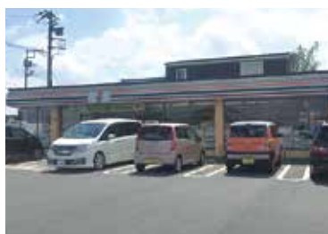
■セブンイレブン 徒歩4分(約290m)