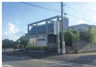
■岡村内科医院 徒歩10分(約800m)