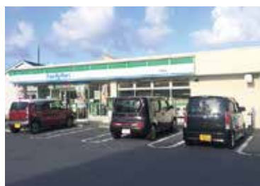
■ファミリーマート 徒歩8分(約589m)