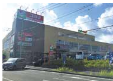
■ヨークマート 徒歩4分(約300m)

いつも安心、ずっと快適。家族と育みながら住み継がれる豊かな街。「アキュラホーム湘南テラス東海大学前」のLife Information。