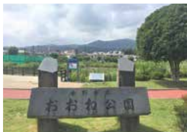
■おおね公園 徒歩14分(約1,058m)