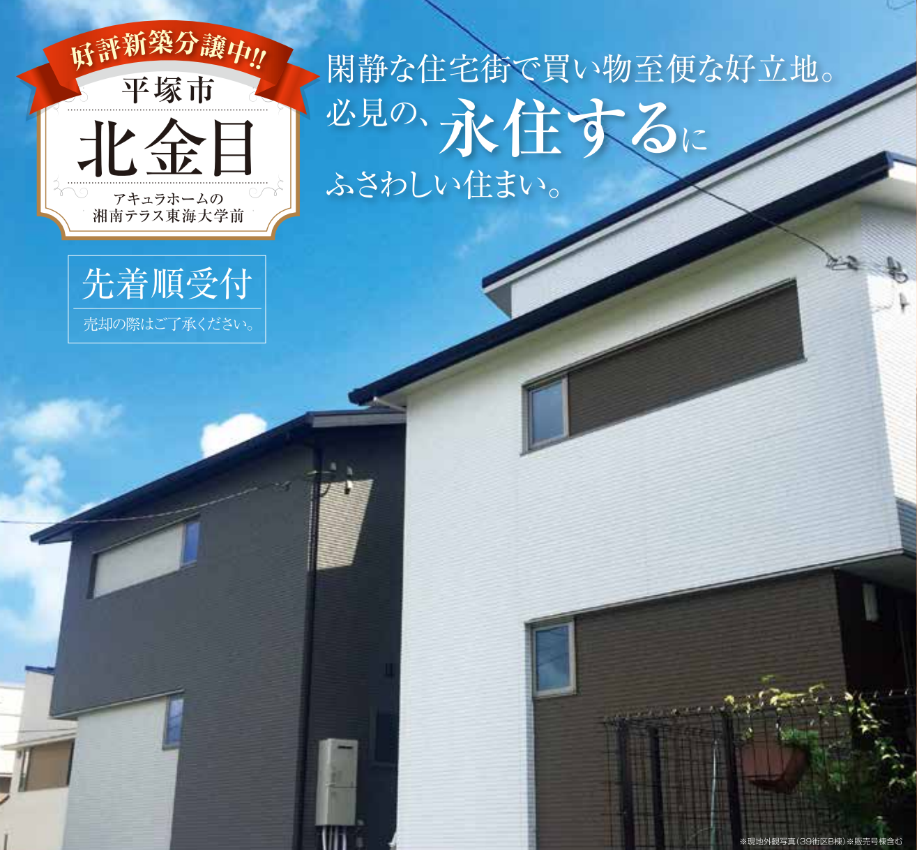
※現地外観写真(39街区B棟)※販売号棟含む